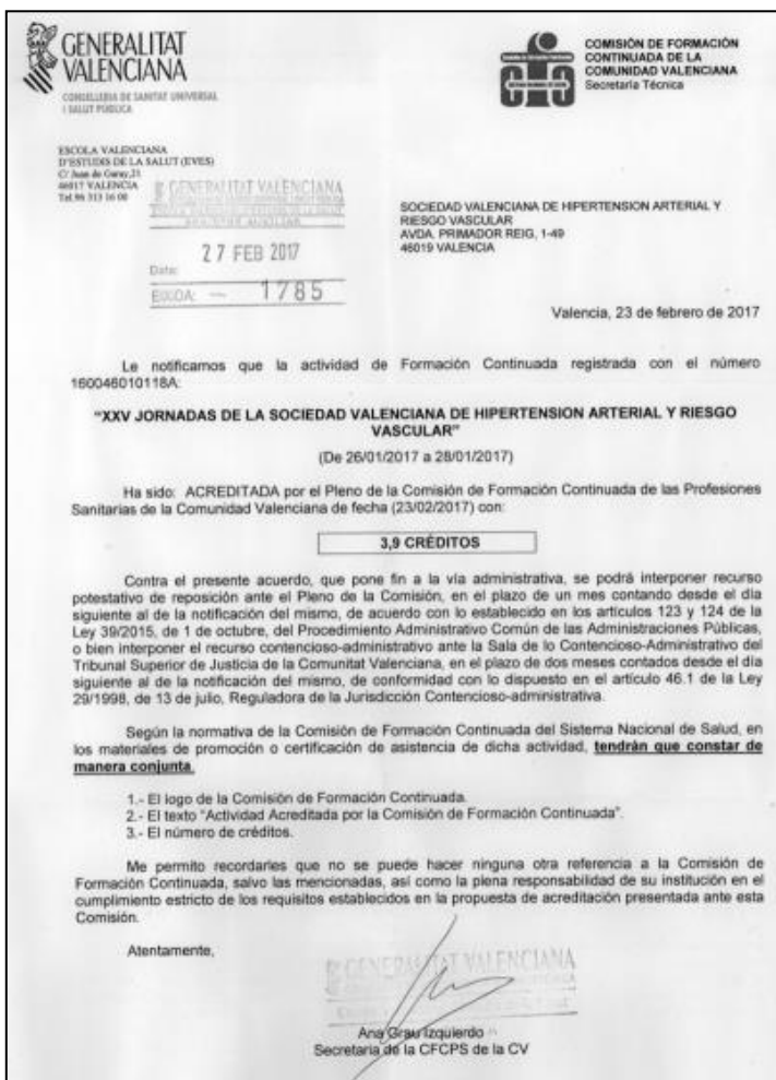
Imagen 1. Certificado de acreditación por la EVES.